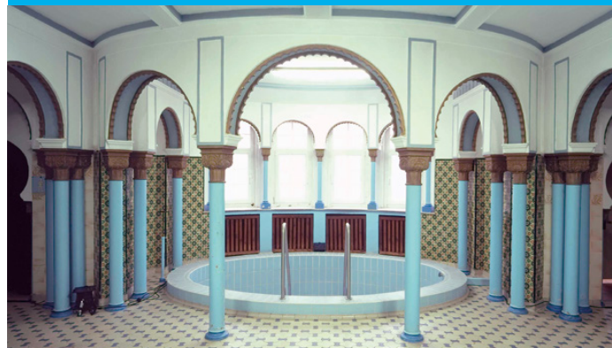
LOST PLACE-ERLEBNIS HISTORISCHES STADTBAD