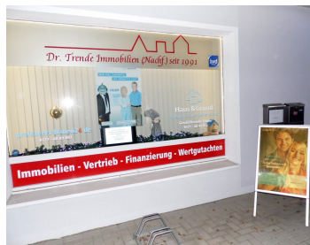
Geschäftsstelle OV Erkner