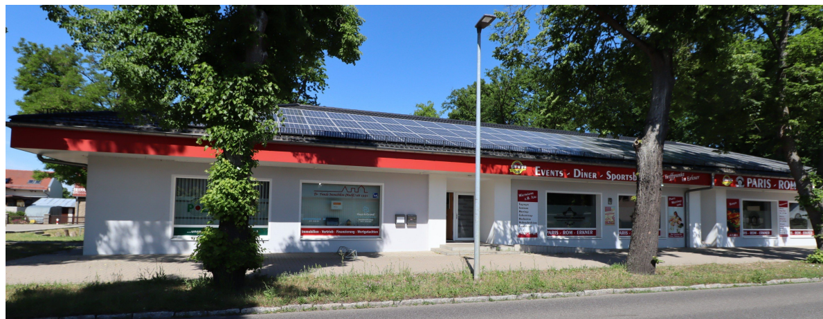
Erkner, Neu Zittauer Straße 15, PARIS-ROM-ERKNER mit dem Eingang zu unserer Geschäftsstelle

Haus & Grund® Eigentum. Schutz. Gemeinschaft. Erkner